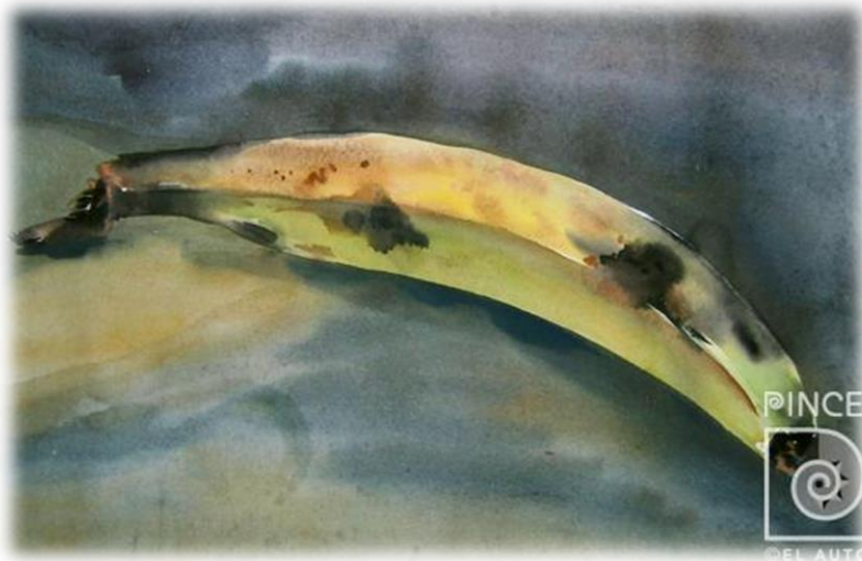
Gran banano, Obra de Fabio Herrera, 1981.