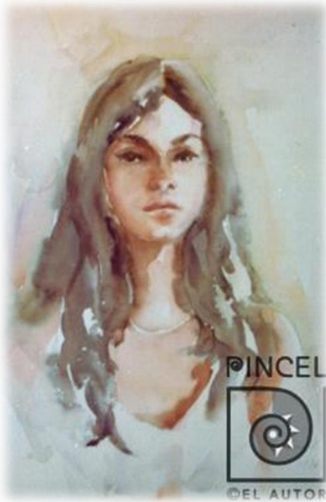
Retrato de joven, Obra de Margarita Gómez, 1976.

Las siguientes imágenes son ejemplo de acuarelas pintadas, con la técnica húmedo sobre húmedo.