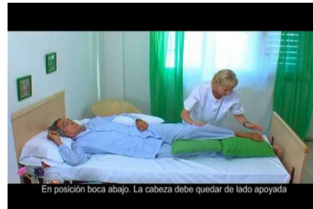
En posición boca abajo. La cabeza debe quedar de lado apoyada