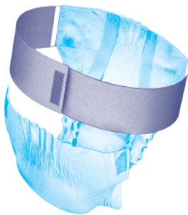
Pañal tipo calzón.