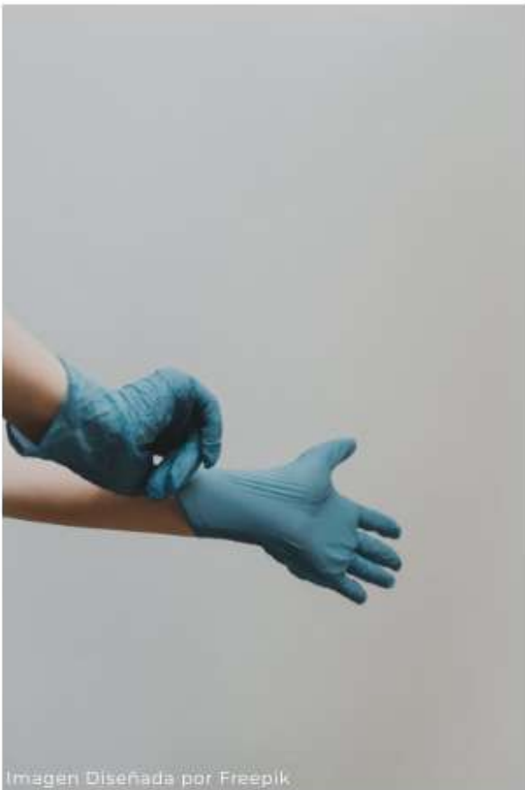
Imagen Diseñada por Freepik