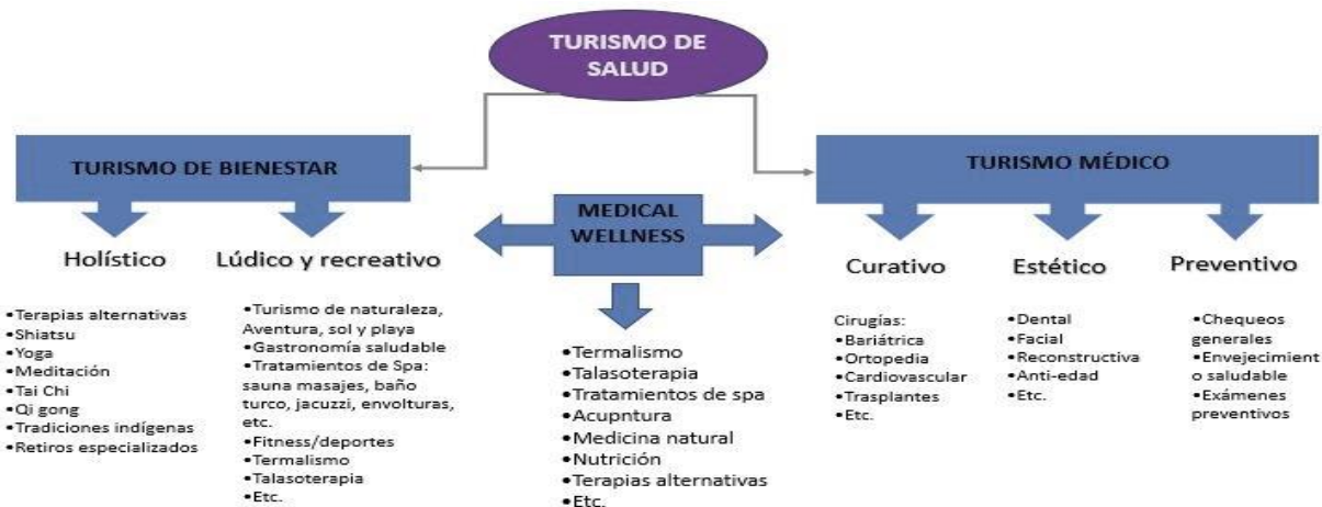
Figura N 1 Turismo de salud.

A raíz de este paradigma, es que se ha venido desarrollando en los últimos años un segmento de turismo conocido como turismo de salud y bienestar, el cual está enfocado en el disfrute y aprovechamiento de los servicios turísticos, bajo patrones holísticos y con matices curativos y preventivos, proyectándose como un segmento de altísimo valor social y económico a nivel mundial.