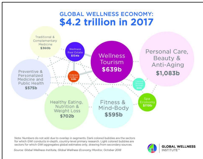
Figura N 3. Economía Global del Bienestar. $4.2 trillones de dólares en 2017.

Dicho potencial se enmarca en el contexto internacional, según evidencia del Global Wellness Institute en su reporte anual para el 2017, donde enfatiza el importante crecimiento del segmento de Turismo de Bienestar con respecto al 2016, demostrando un incremento de cerca de usd$ 76 billones de dólares, pasando de usd$563 billones de dólares a unos nada despreciables $639 billones de dólares a nivel mundial, lo que presenta un crecimiento anual del 6.4% según se presenta en el informe (Yeung y Johnston, 2018).