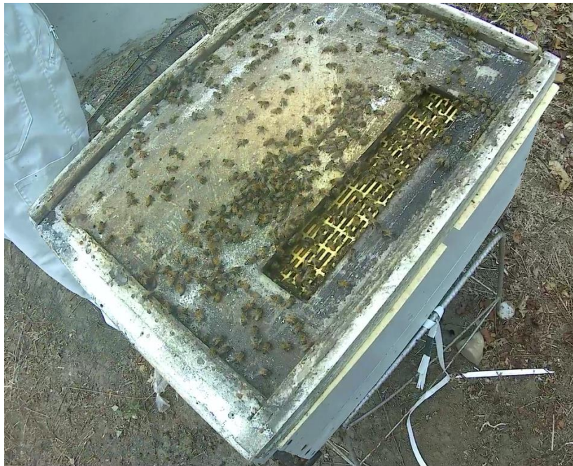
Imagen n.8: Tabla y rejilla excluidora divisoria usada para la finalización de celdas reales.

El marco porta celdas se ubica en el centro de la colmena (o alza) finalizadora, a ambos lados de este se coloca panales de cría abierta , los cuales atraerán abeja nodriza hacia el centro del nido. A cada lado de la cría abierta se coloca un marco de cría sellada . Todo esto ayuda a mantener el calor interno del nido. Al lado de la cría sellada se colocan los panales de reservas alimenticias (polen al lado de la cría y miel). Es recomendable también colocar un alimentador y alimento abundante durante la etapa abierta de las celdas reales.