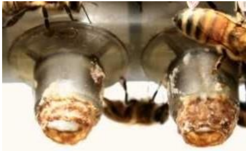
Imagen n.7: Copas celdas aceptadas.

La finalización de celdas reales puede llevarse a cabo en la misma colmena aceptadora o en una distinta. Este es el proceso en el cual las celdas reales serán llevadas a término. Es importante que la colmena finalizadora tenga una gran fortaleza , debido a que esta colmena deberá alimentar las celdas reales y ello es determinante en la calidad de las reinas (Ramírez, 2005).