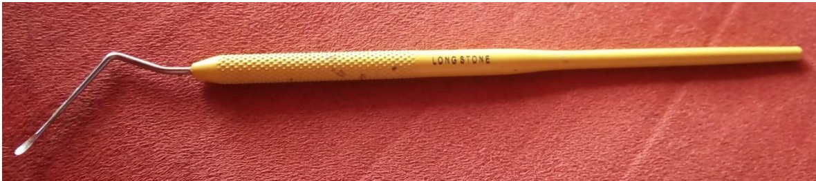
Imagen n.6: Aguja de transferencia.

Es importante no arrastrar las larvas por las paredes de la celda, ya que estas son muy delicadas y las larvas con daños son rechazadas (Connor, 2015).