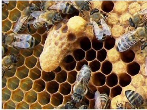
Imagen n.3: Celda real de emergencia.

La colmena aceptadora debe ser provista de al menos un panel de reservas alimenticias y agua . Este último se puede proveer en una toalla, esponja o panel desocupado humedecido (Connor, 2015).