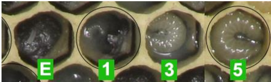
Imagen n.4: Desarrollo larvario según día.

E: Huevo. 1: Larva de un día. 3: Larva de tres días. 5: Larva de cinco días.