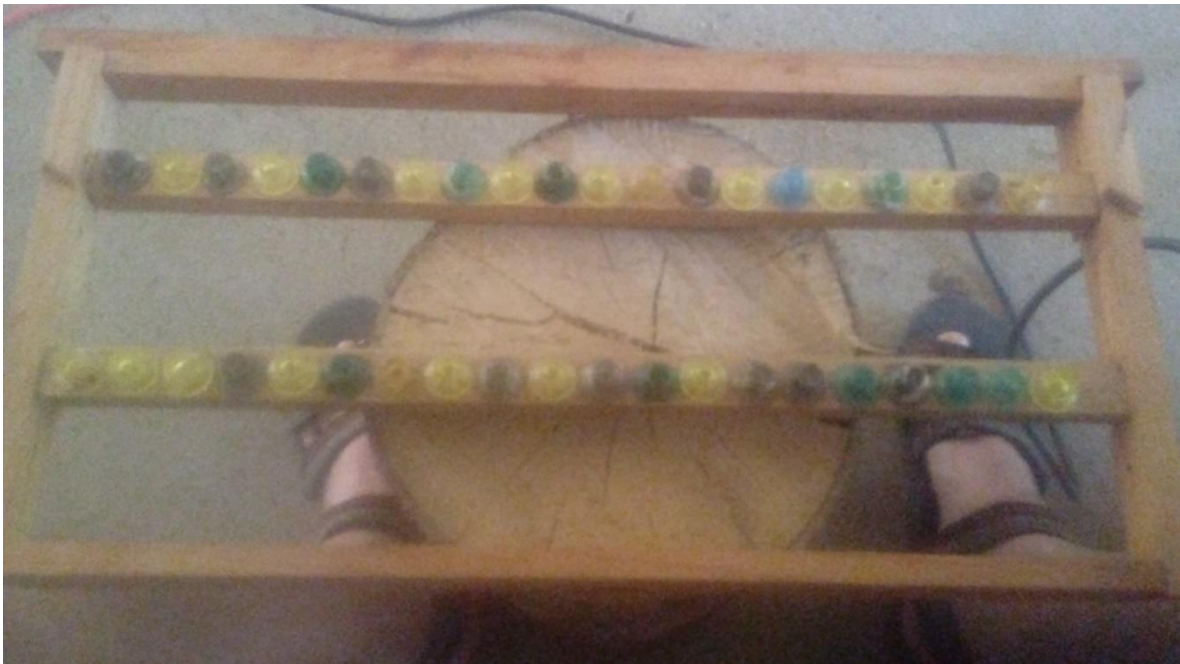
Imagen n.2: Marco porta celdas.

Antes de ingresar el marco porta celdas con la larva transferida, debe cerciorarse de que la colmena aceptadora carezca de nuevas celdas reales de emergencia (Imagen n.3) . Es importante también remover cualquier panal con cría menor de tres días ( Imagen n.4 ), para que ella dirija sus esfuerzos a criar la larva que se le vaya a proporcionar en el marco porta celdas.