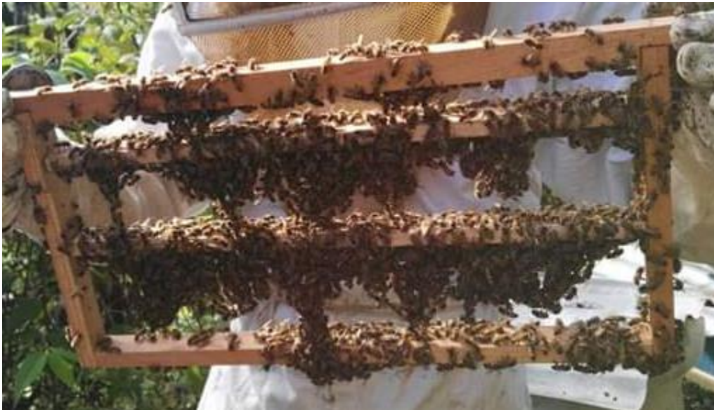
Imagen n.1: Formación de barbas de abejas en marco porta celdas.

La colmena aceptadora debe ser mantenida sin la presencia de celdas reales en sus panales de cría durante el proceso de la crianza de reinas. Esta colmena recibe el marco porta celdas ( Imagen n.2 ), con las copas celdas artificiales 24 horas antes de la transferencia de larvas. Este proceso se conoce como familiarización ,