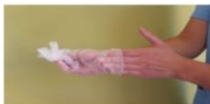
Retirar el segundo guante introduciendo los dedos por el interior