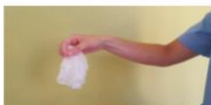
Retirar los dos guantes en el contenedor adecuado