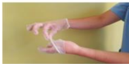
Retirar sin tocar la parte interior del guante