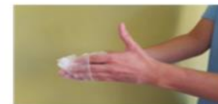
Retirar el guante sin tocar la parte externa del mismo