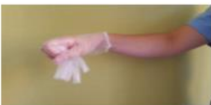
Recoger el primer guante con la otra mano