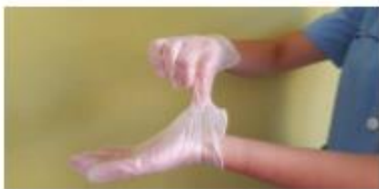
Pellizcar por el exterior del primer guante