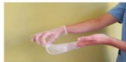
Retirar el guante en su totalidad