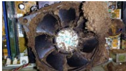
HOFFMAN. N. 2020. Ilustración [polvo en ventiladores]. Recuperado de https://hoffman-latam.com