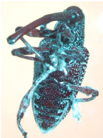
Figura 3. Picudo de palma aceitera ( Rhynchophorus palmarum ) parasitado por el hongo entomopatógeno Metarhizium anisopliae .

y esterasas que facilitan el proceso de penetración. Otra vía de entrada, es a través del tracto digestivo pero, generalmente los conidios no pueden germinar en el intestino. Durante la fase saprofitica, la multiplicación del hongo ocurre por gemación de blastosporas y producción de hifas dentro del hemocele del insecto, con un abundante crecimiento del hongo. Finalmente, el hongo invade los tejidos y como consecuencia ocurre la muerte del hospedante, y después de la muerte el hongo emerge al exterior concluyendo con la producción de conidios sobre la superficie rodeando el cadáver del insecto (Figura 3) y permitiendo su diseminación.